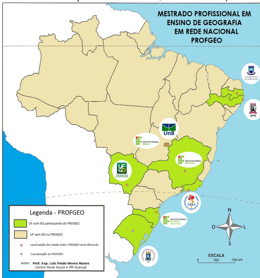
Figura 2 - Rede nacional pioneira do PROFGEO, com nove instituições associadas.