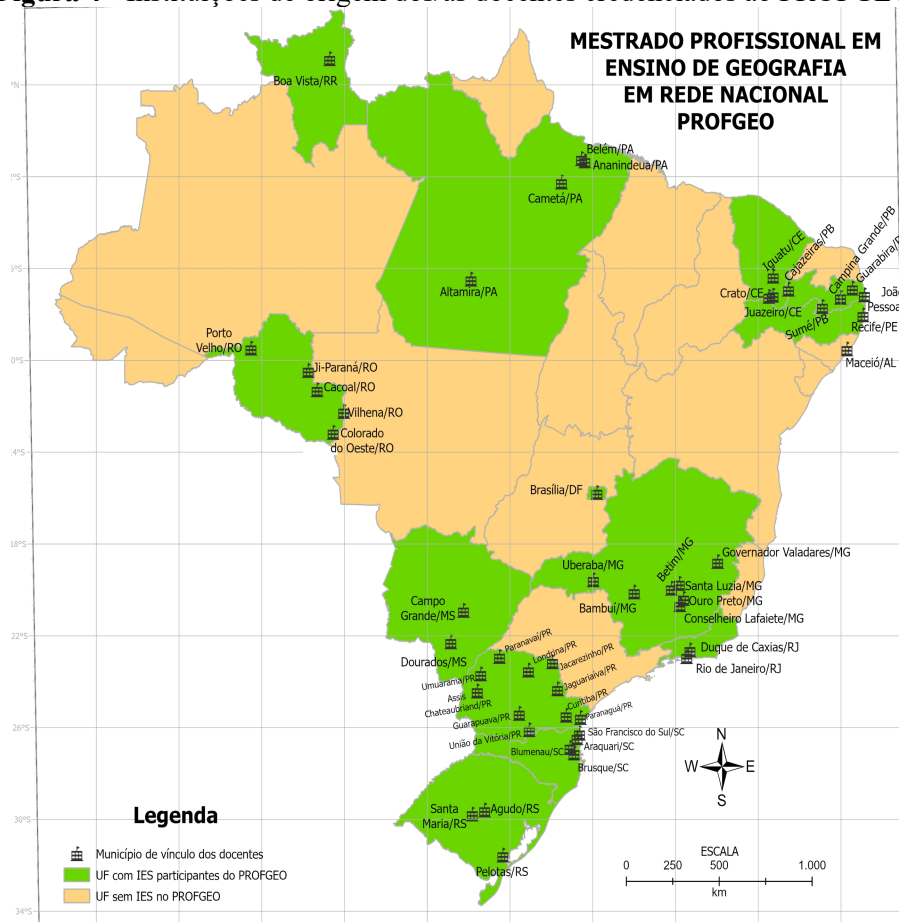
Figura 4 - Instituições de origem dos/as docentes credenciados ao PROFGEO.