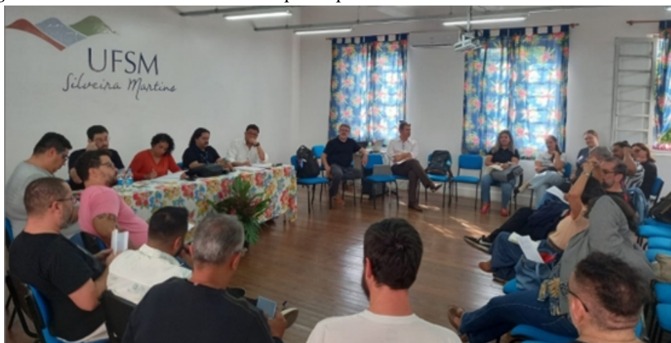
Figura 5 - Roda de conversa entre os participantes do I Encontro Nacional do PROFGEO.