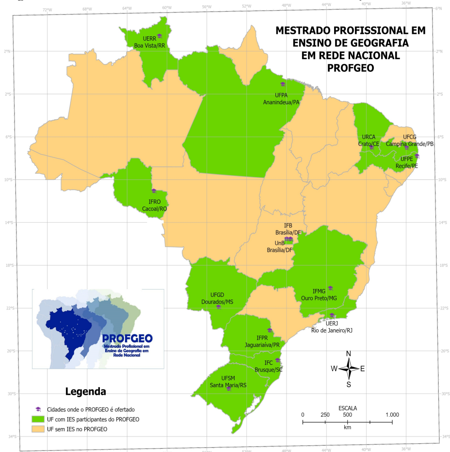
Figura 3 - Rede Nacional do PROFGEO, com catorze instituições associadas.