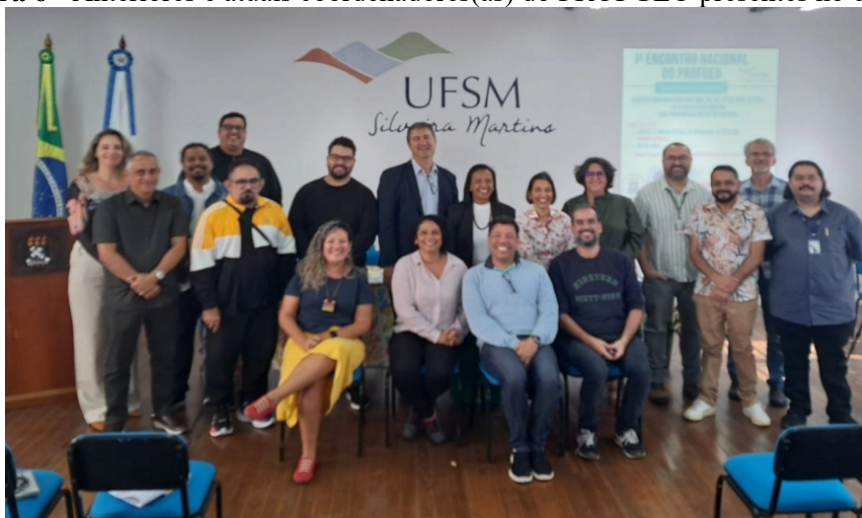
Figura 6 - Anteriores e atuais coordenadores(as) do PROFGEO presentes no evento.