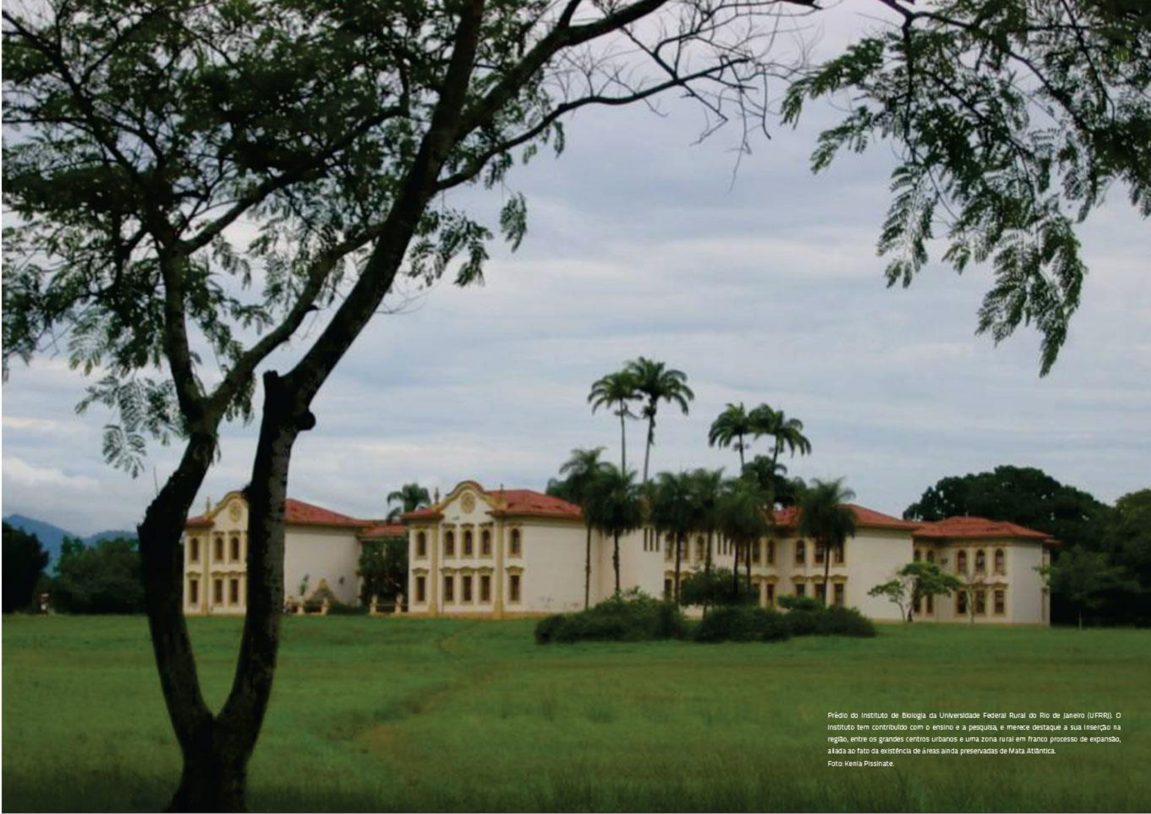
Prédio do Instituto de Biologia da Universidade Federal Rural do Rio de Janeiro (UFRRJ). O Instituto tem contribuído com o ensino e a pesquisa, e merece destaque a sua inserção na região, entre os grandes centros urbanos e uma zona rural em franco processo de expansão, aliada ao fato da existência de áreas ainda preservadas de Mata Atlântica.