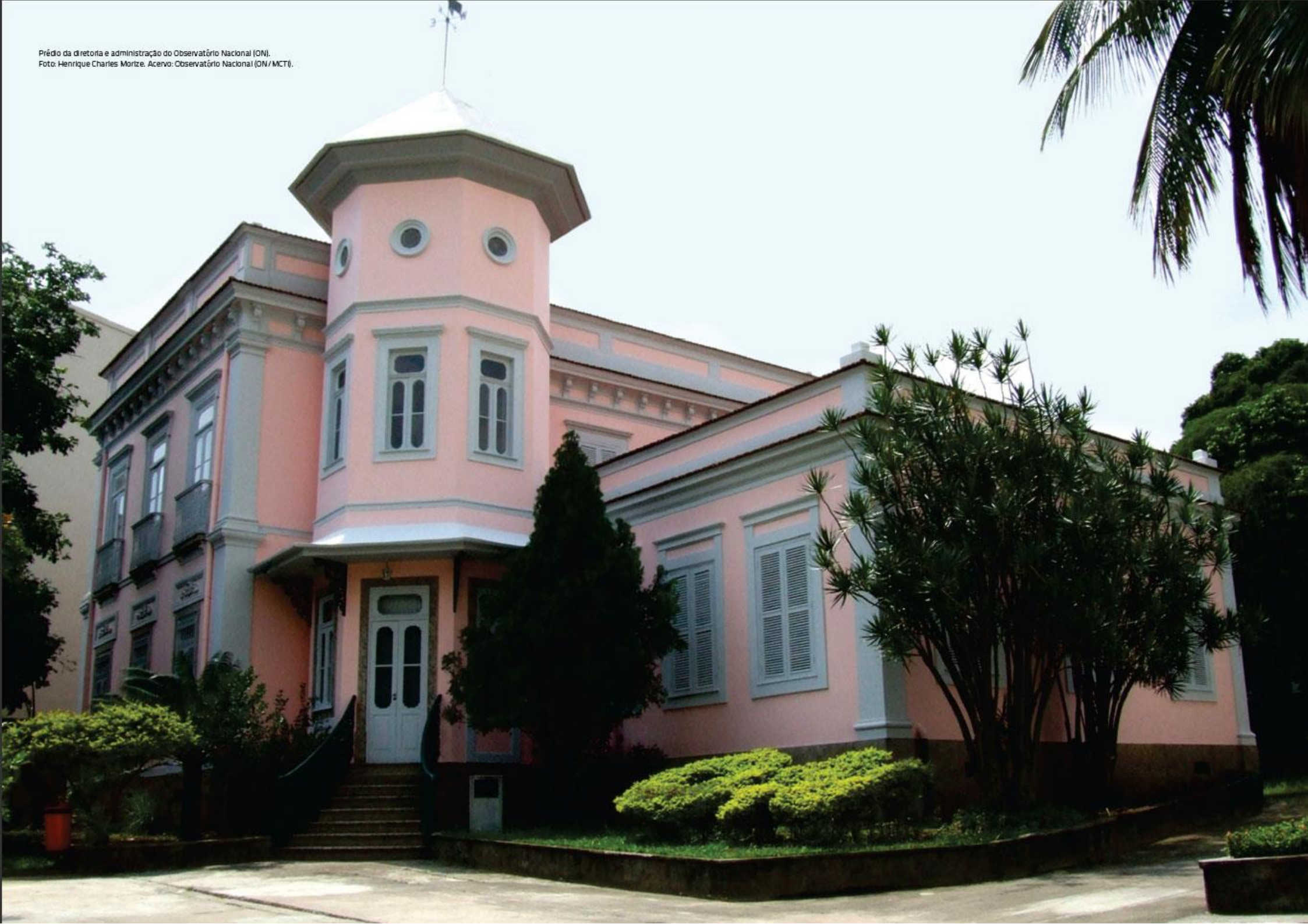
Prédio da diretoria e administração do Observatório Nacional (ON).