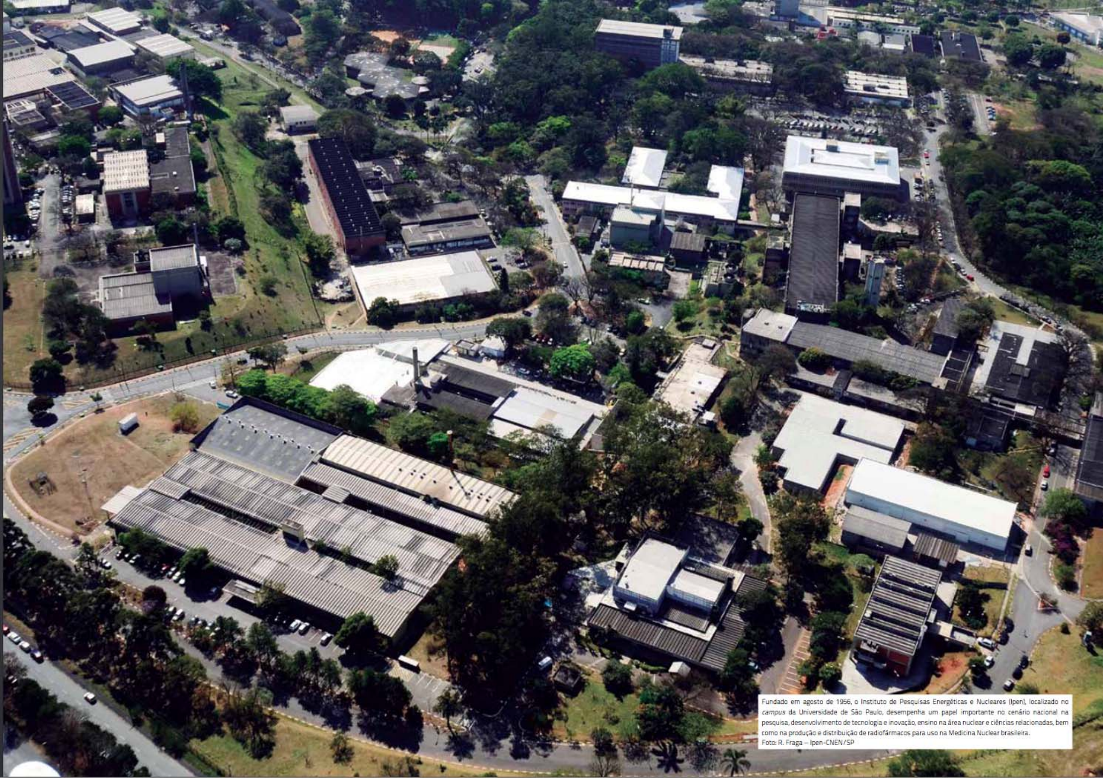
Fundado em agosto de 1956, o Instituto de Pesquisas Energéticas e Nucleares (Ipen), localizado no campus da Universidade de São Paulo, desempenha um papel importante no cenário nacional na pesquisa, desenvolvimento de tecnologia e inovação, ensino na área nuclear e ciências relacionadas, bem como na produção e distribuição de radiofármacos para uso na Medicina Nuclear brasileira.