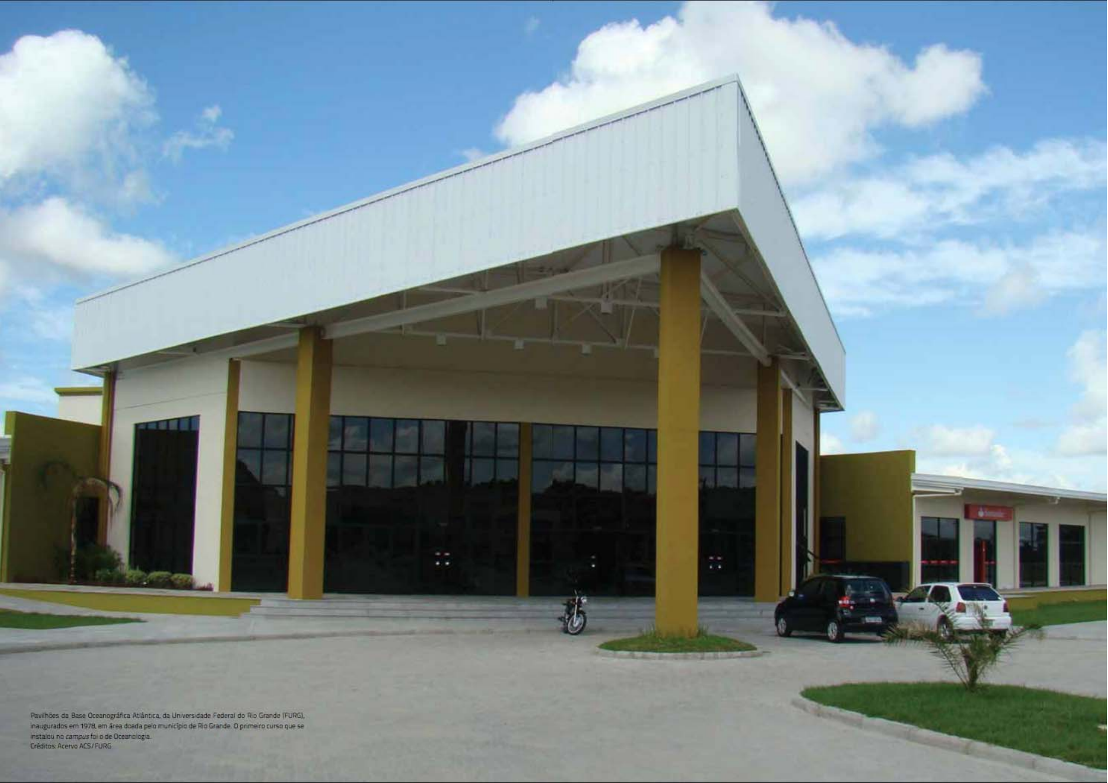
Pavilhões da Base Oceanográfica Atlântica, da Universidade Federal do Rio Grande (FURG), inaugurados em 1978, em área doada pelo município de Rio Grande. O primeiro curso que se instalou no campus foi o de Oceanologia.